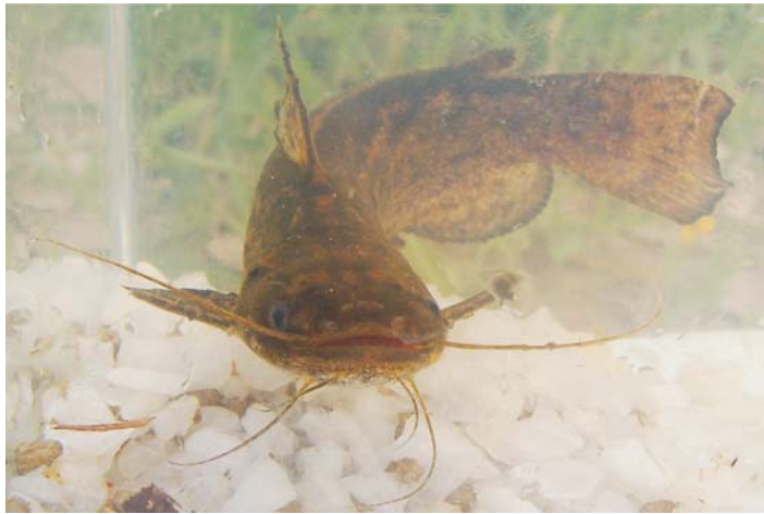
Figura 3: Parauchenipterus striatulus