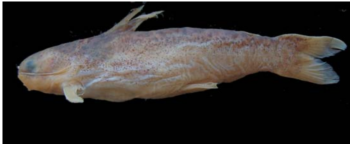
Figura 2: Glanidium albescens

Distribuição: vale dos rios Jequitinhonha e Canavieiras (Akama & Sarmiento-Soares, 2007).