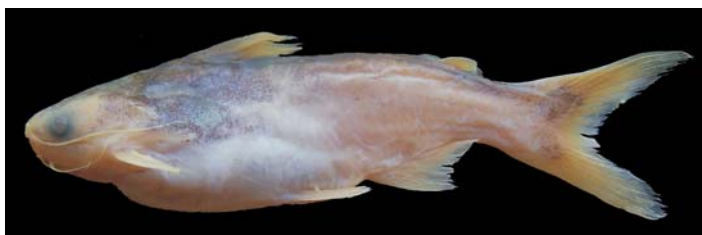
Figura 4: Pseudauchenipterus affinis