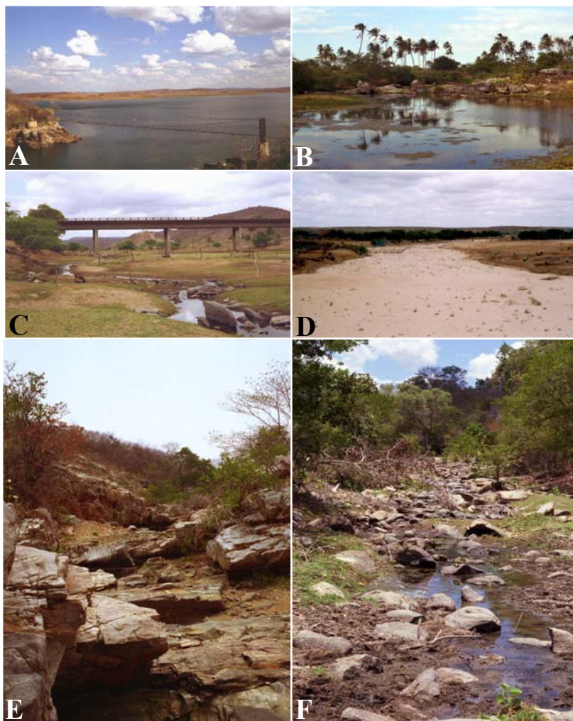
Figura 3. Áreas onde os peixes foram coletados. (A) Açude Mãe-D'Água, Coremas, PB; (B) rio Paraíba do Norte, Cruz do Espírito Santo, PB; (C) rio Paraíba do Norte, ponte PB 408, próximo a Umbuzeiro, PB; (D) leito seco do rio Taperoá, bacia do rio Paraíba do Norte, próximo a Cabaceiras, PB; (E) Olho D'Água do Frade, Nazarezinho, PB, cabeceira da bacia do rio Piranhas e (F) cabeceira do riacho Camurim, rio Paraíba do Norte, Salgado do São Félix, PB.